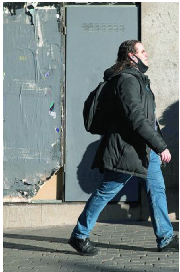
Sanidad insiste en el uso de la mascarilla en plena sexta ola

De hecho, una persona no infectada a tres metros de distancia de otra infectada y sin mascarilla, tiene un 100% de posibilidades de contagiarse. Sin embargo, si ambas llevan mascarilla FFP2, el riesgo es de una infección cada 1.000.